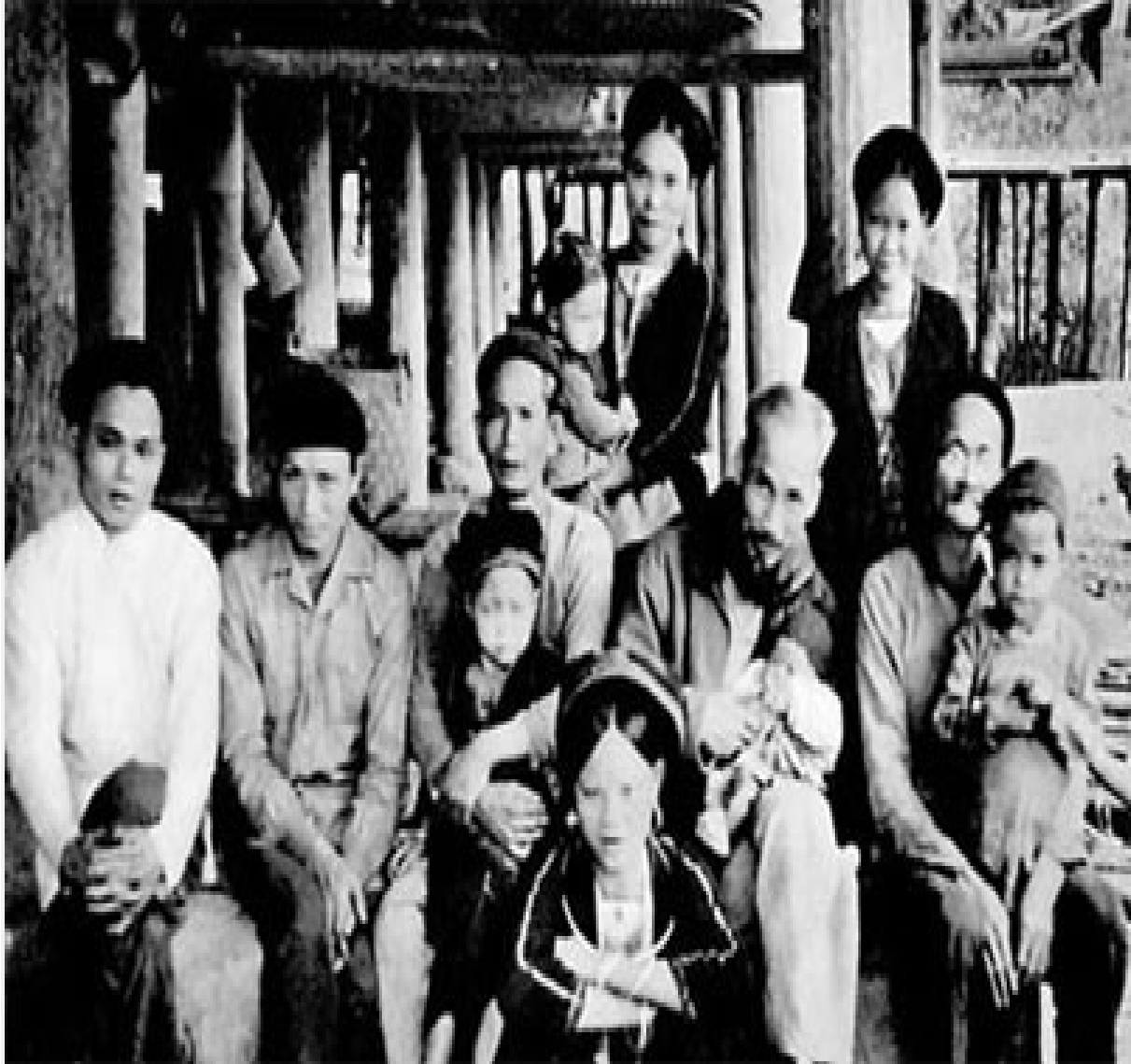
Bác Hồ ở chiến khu Việt Bắc